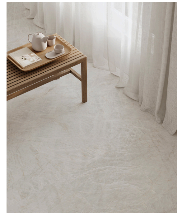
G8029 Taj Mahal Pearl 60x60 / 23.6"x23.6"