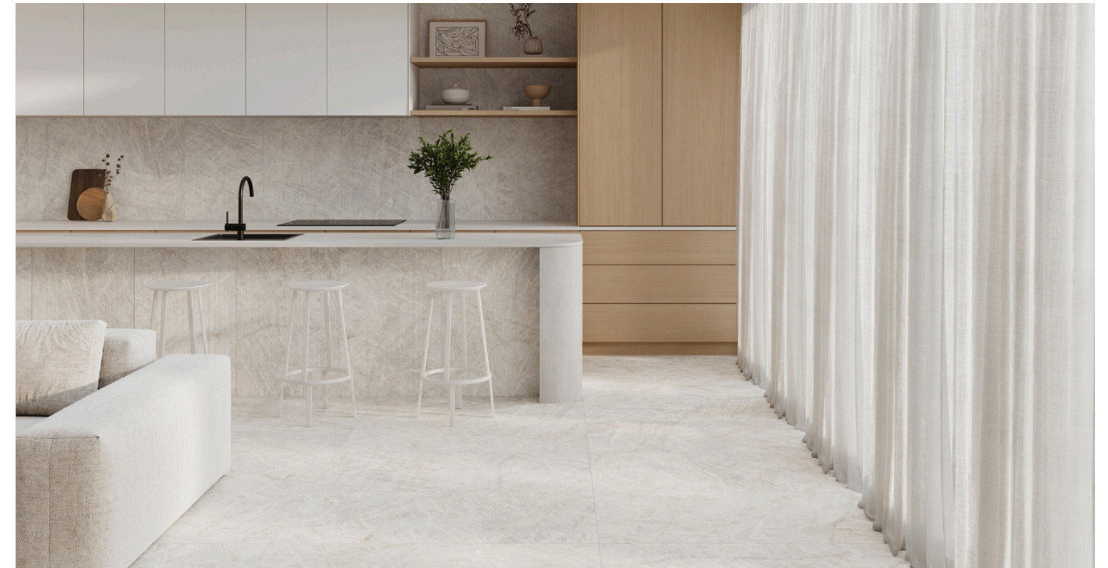
G8029 Taj Mahal Pearl 60x60 / 23.6"x23.6"