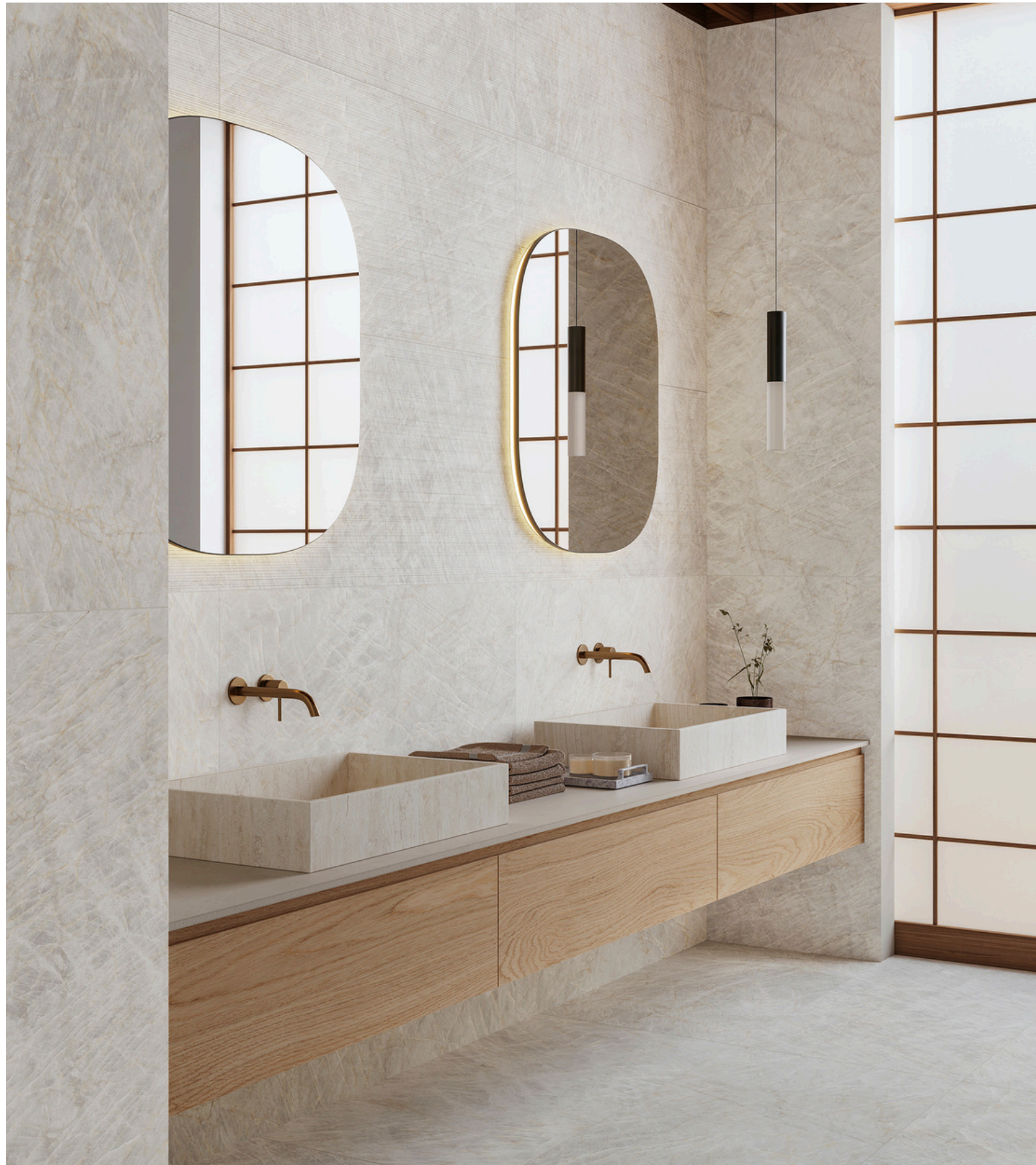
G8029 Taj Mahal Pearl 60x60 / 23.6"x23.6"