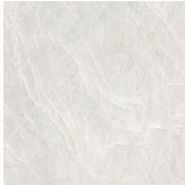
G8029 Taj Mahal Pearl 60x60 / 23.6"x23.6"

DESARROLLO GRÁFICO GRAPHIC DEVELOPMENT DÉVELOPPEMENT GRAPHIQUE GRAFISCHE VIELFALT ГРАФИЧЕСКОЕ РАЗВИТИЕ