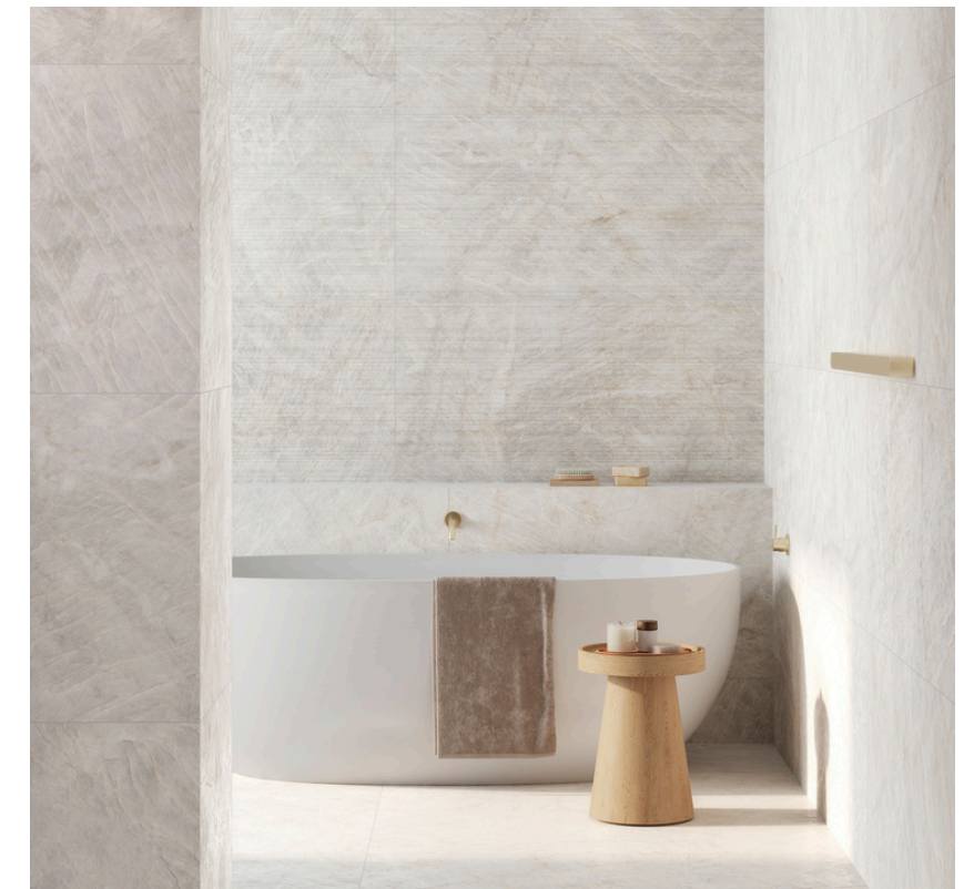
G8029 Taj Mahal Pearl 60x60 / 23.6"x23.6"