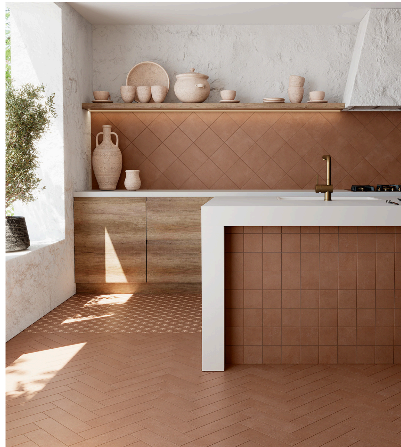
G2711 Nok Burnt Terracotta 7.5x30 / 2.95"x11.81"