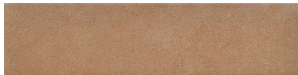
G2710 Nok Terracotta Sand 7.5x30 / 2.95"x11.81"