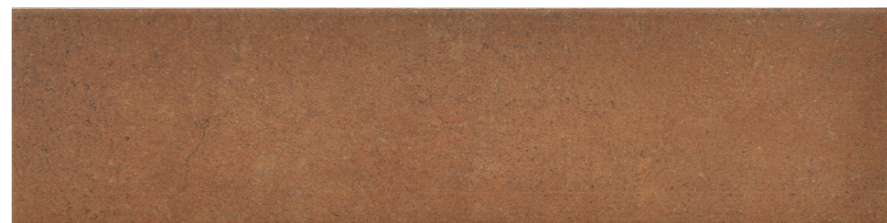
G2711 Nok Burnt Terracotta 7.5x30 / 2.95"x11.81"