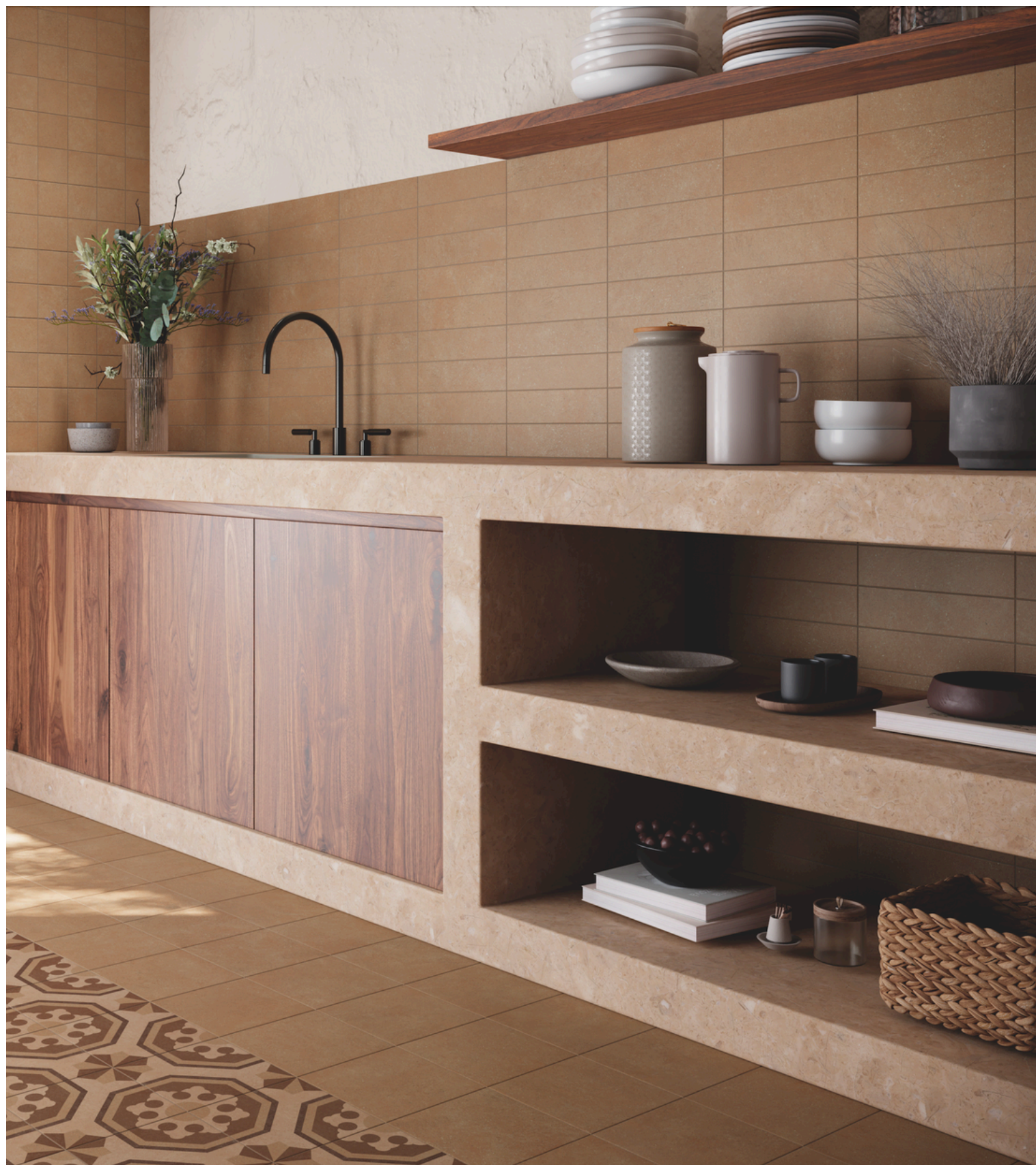
G2710 Nok Terracotta Sand 7.5x30 / 2.95"x11.81"