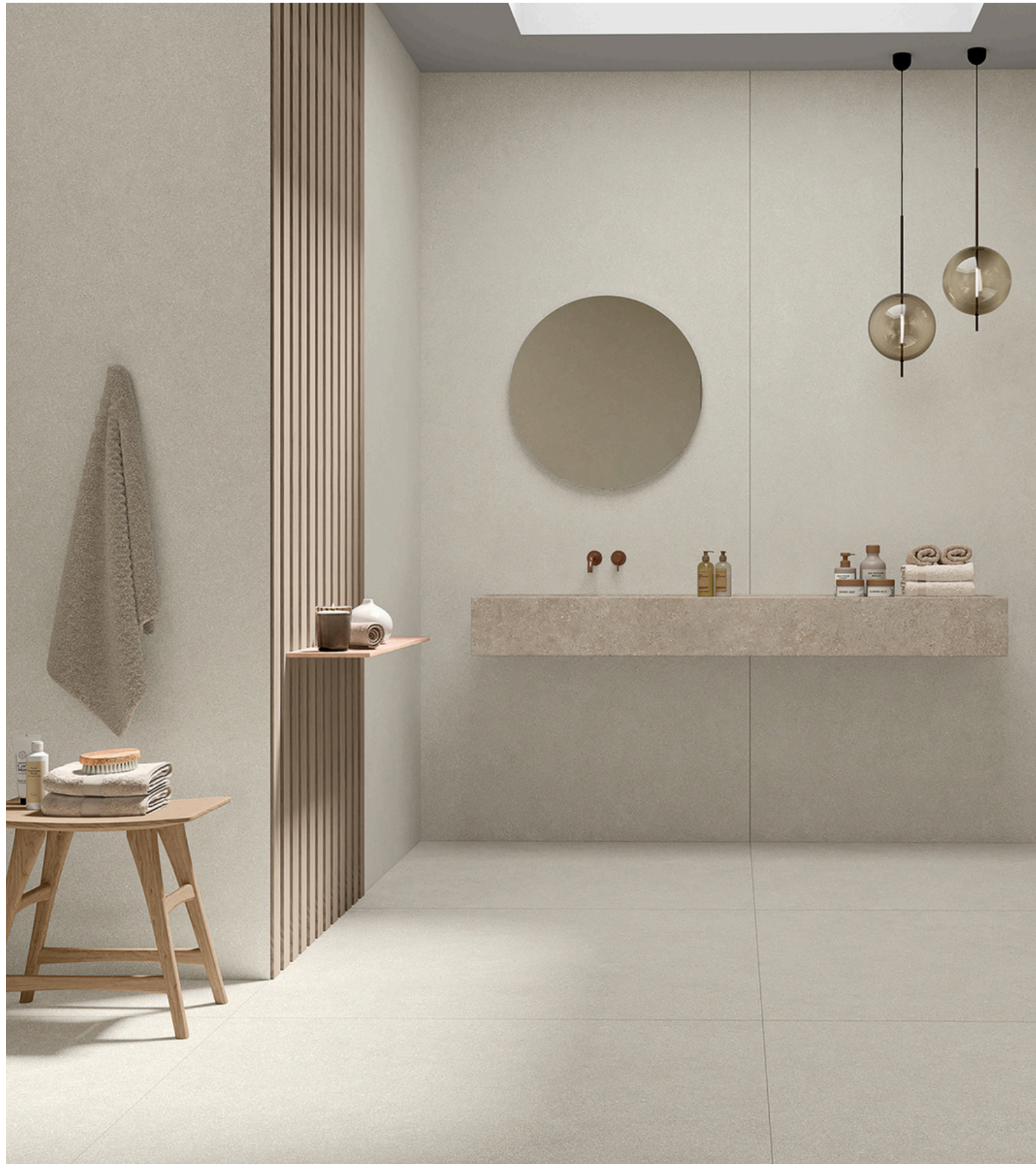
G8832 Kyoto Beige 60x60 / 24"x24"