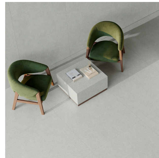
G8831 Kyoto Gray 60x60 / 24"x24"