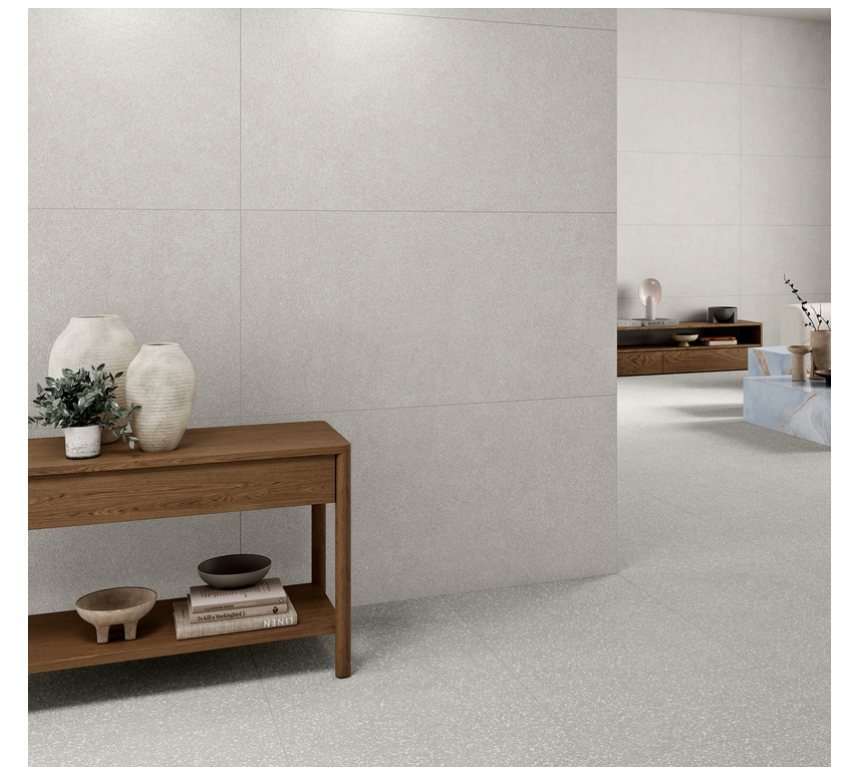
G8830 Kyoto White 60x60 / 24"x24"