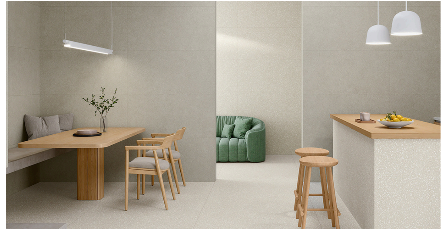
G8832 Kyoto Beige 60x60 / 24"x24"