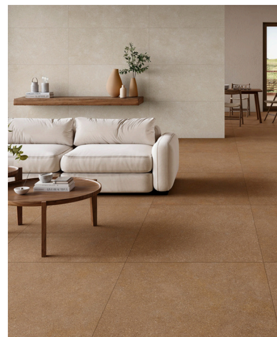
G8842 Ciottoli Terracotta 60x60 / 23.42"x23.42"