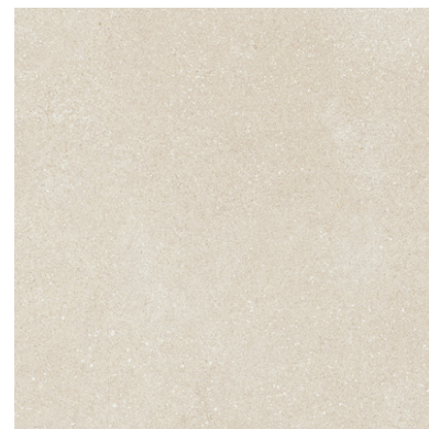
G8841 Ciottoli Ivory 60x60cm / 23.42"x23.42"