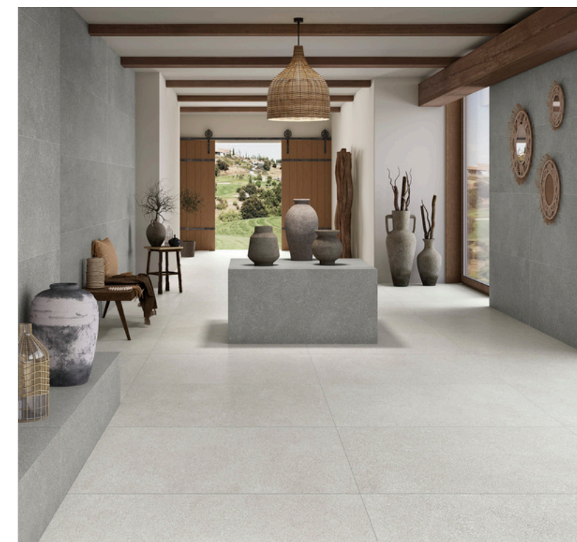
G8840 Ciottoli White 60x60 / 23.42"x23.42"