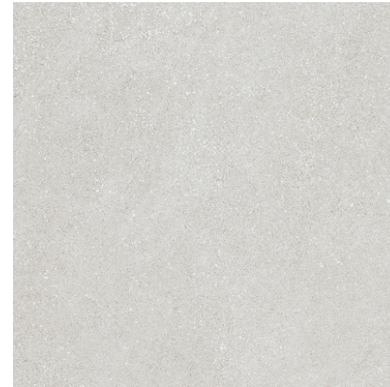
G8840 Ciottoli White 60x60cm / 23.42"x23.42"