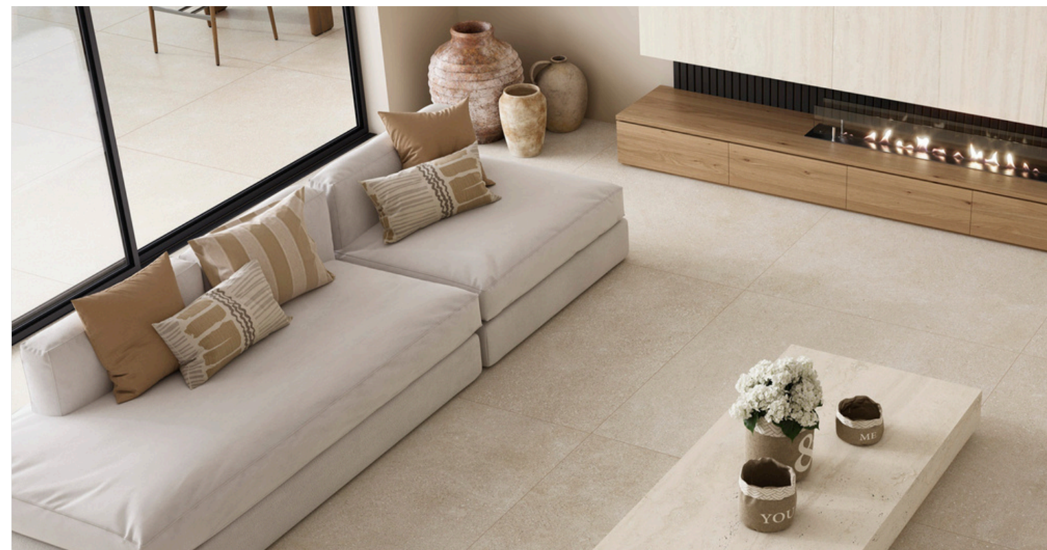
G8841 Ciottoli Ivory 60x60 / 23.42"x23.42"