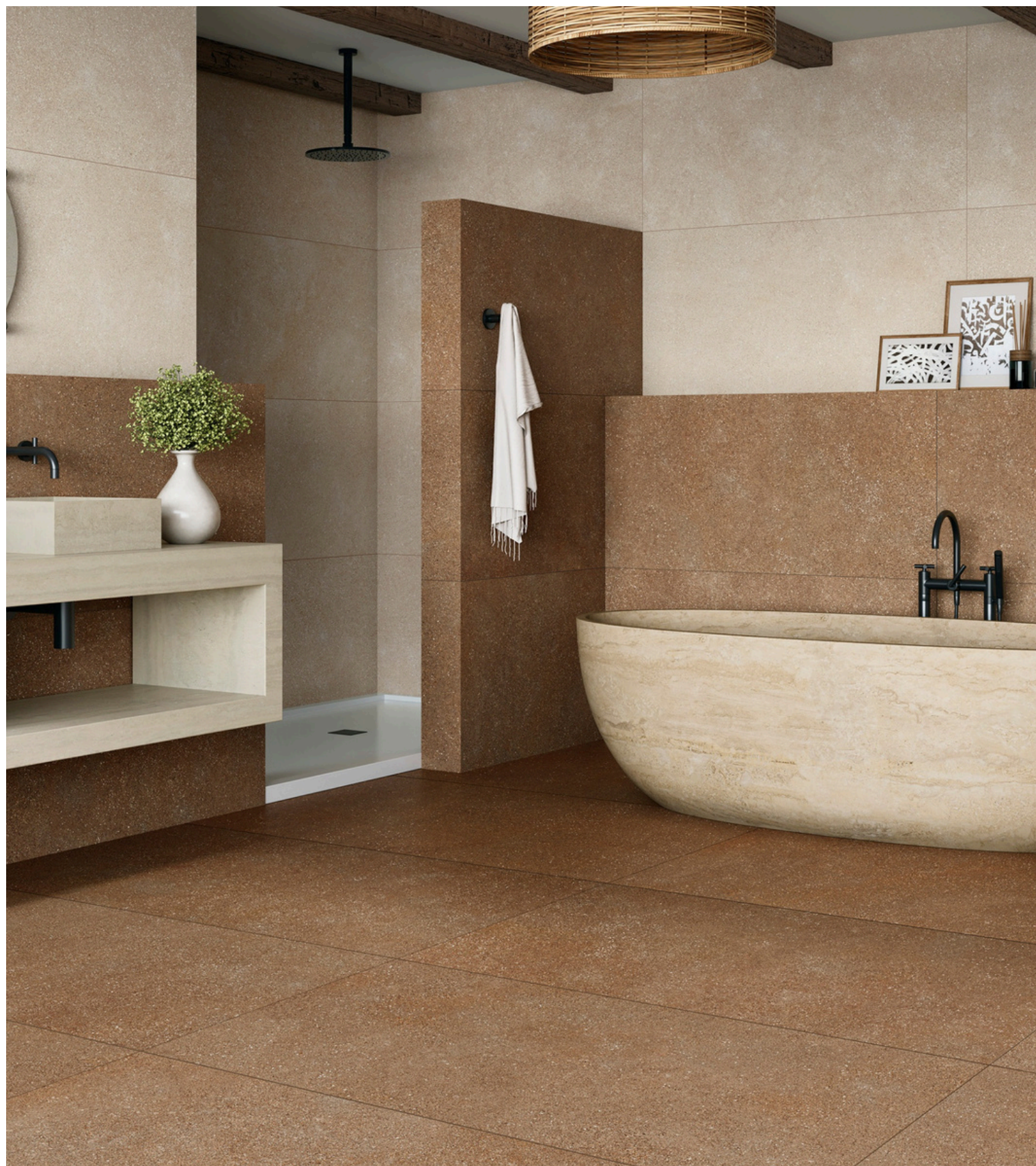
G8842 Ciottoli Terracotta 60x60 / 23.42"x23.42"