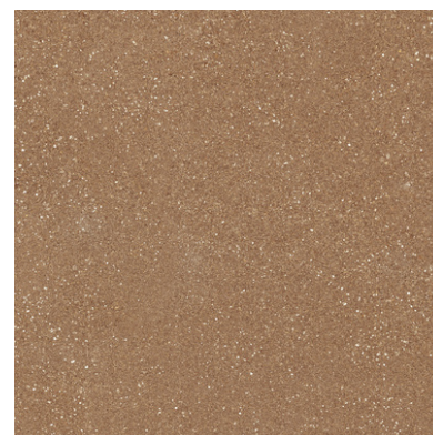
G8842 Ciottoli Terracotta 60x60cm / 23.42"x23.42"